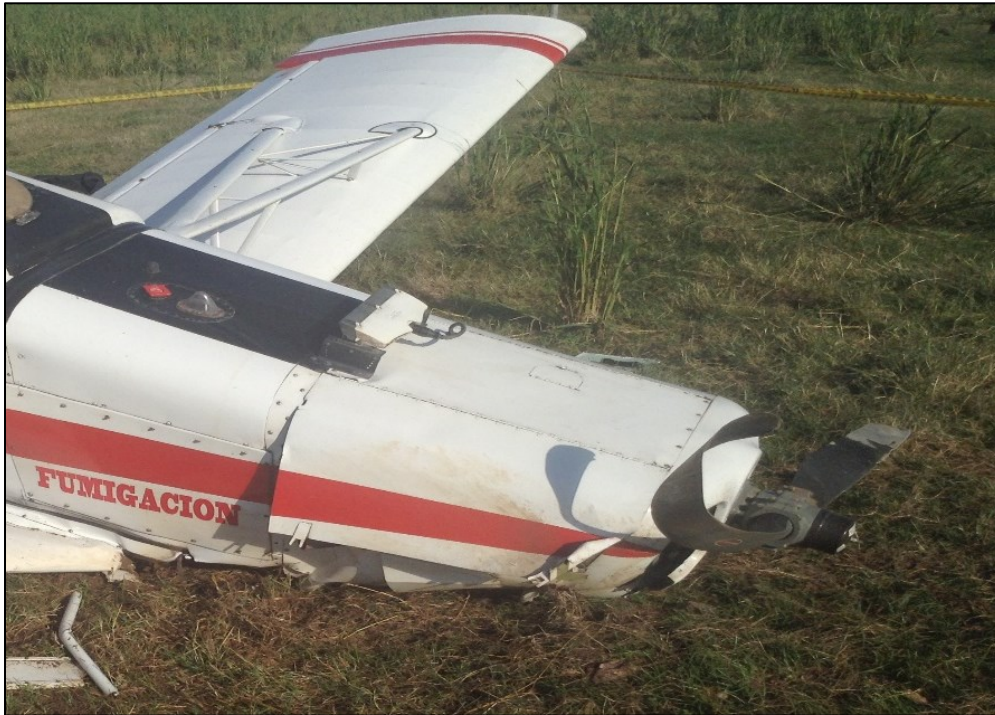
Fotografía No. 3: Presencia de rulo en las palas de la Hélice HK-1290