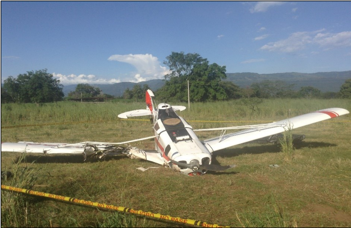
Fotografía No. 1: Estado final de la aeronave HK-1290