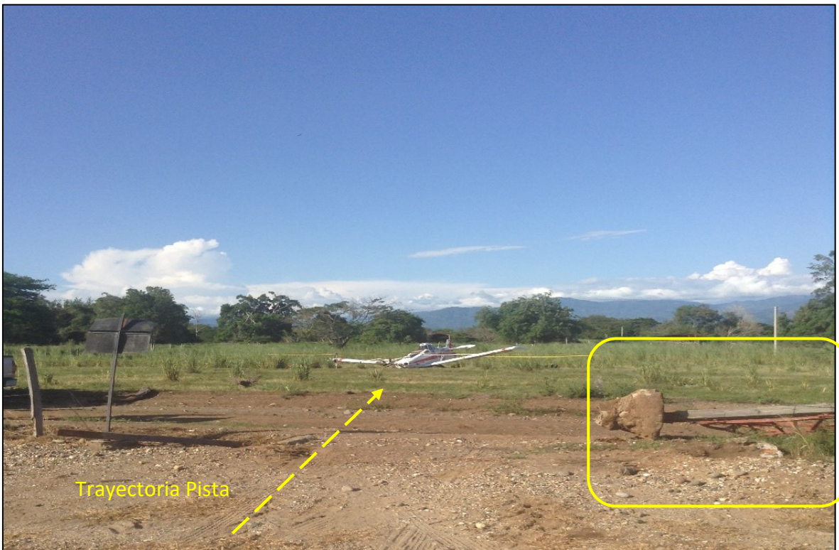
Fotografía No. 2: Portón de hierro de la cerca perimetral Instalado a 10 metro de la cabecera 23 pista Pajonales

Daños al portón de hierro de la cerca perimetral, instalado aproximadamente a 10 metros de la cabecera 23 de la pista Pajonales en la trayectoria de la pista.